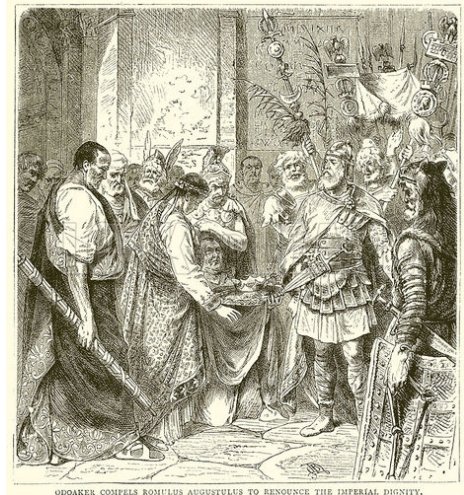
ODOAKER COMPELS ROMULUS AUGUSTULUS TO RENOUNCE THE IMPERIAL DIGNITY.

i mąż stanu Victor Duruy (1811-1894) proponuje liczyć średniowiecze od bitwy pod Adrianopolem (378 r.), w której Wizygoci zadali druzgocącą klęskę Rzymianom, ponieważ dała ona początek przewadze Germanów w Cesarstwie Rzymskim i wędrówkom ludów. Wydarzenia te doprowadziły w następstwie do upadku Cesarstwa Rzymskiego na Zachodzie i powstania państw barbarzyńskich na jego gruzach. Od przeszło 100 lat w historiografii francuskiej pojawia się data śmierci cesarza Teodozjusza Wielkiego (395 r.) jako początek średniowiecza. Władca ten podzielił na łożu śmierci Cesarstwo Rzymskie między dwóch synów na Wschód i Zachód. Podobny podział pojawiał się już wcześniej, ale tym razem okazał się trwały: Zachód został zdominowany przez barbarzyńców, Wschód okrojony przez napierających nań wrogów, w ewoluującej wciąż formie przetrwał aż do końca średniowiecza. W literaturze niemieckiej, a za nią również w polskiej, dominuje występująca już u humanisty Leonardo Bruniego data abdykacji ostatniego cesarza zachodniorzymskiego Romulusa Augustulusa (476 r.) jako przełom starożytności i średniowiecza.